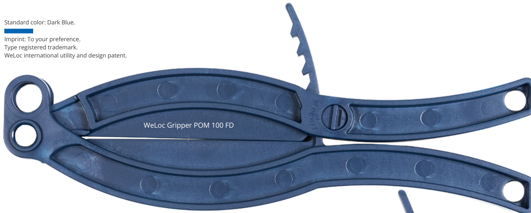
WeLoc Gripper POM 100 FD