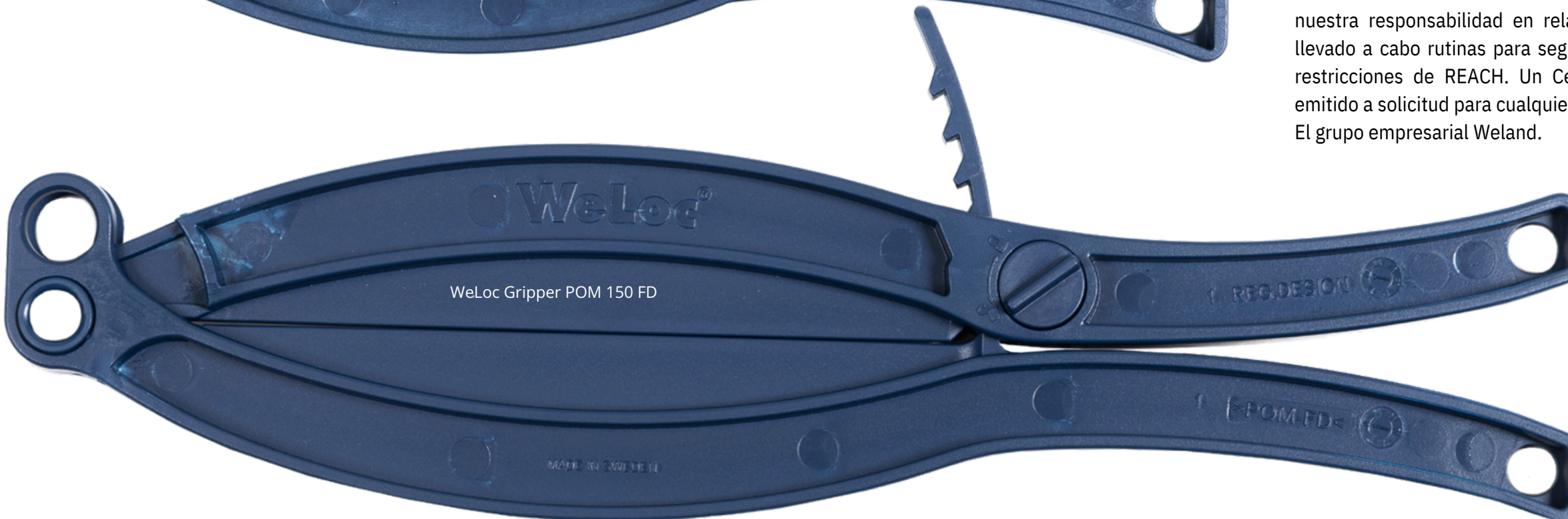
WeLoc Gripper POM 150 FD

WeLoc Gripper POM 100 FD y Gripper POM 150 FD son cierres de saco potentes, totalmente detectables por metales y rayos X, diseñados para la industria alimentaria y farmacéutica.